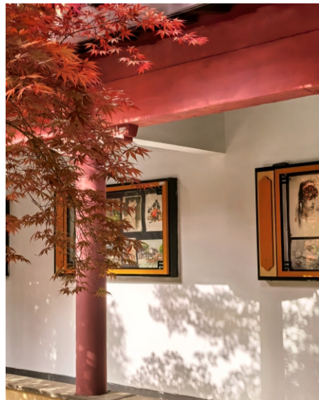
枫影画墙（摄于万寿宫内 马晓凡）