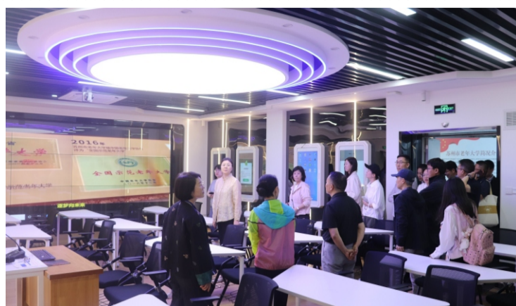
5月9日, 2026年全民终身学习活动周期间, 参加推进老年大学教育高质量发展研讨会的代表一行152人来校考察。图为代表们在学校智慧教室参观。(综合办)