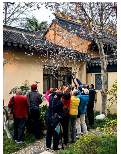
万寿宫里追网红