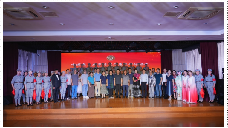
中国老年大学标准示范校评估验收组在观看了我校老年学员演出后与演员的合影。(综合办)

学校网址： http://szlndx.suzhou.edu.cn 2024年第5期 总163期 准印证号：S(2024)05000024 (内部资料 免费交流) 2024年09月09日