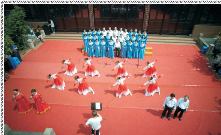
苏州市老年大学第十届文化艺术节的重头戏之一：文艺演出于五月二十日上午拉开帷幕。共900多学员上场表演，用一周时间以形式多样的节目来展示学员风采。本图和本版下端和3版的“芳华”栏目均为演出场景。

学校网址： http://szlndx.suzhou.edu.cn 2024年第4期 总162期 准印证号：S(2024)05000024 (内部资料 免费交流) 2024年06月03日