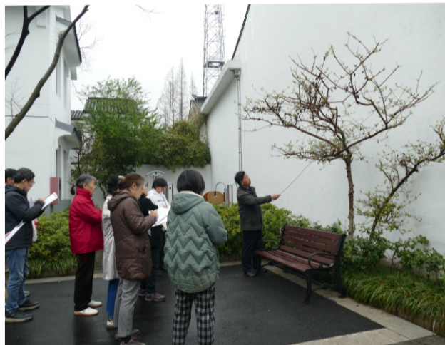
山水提高二(2)班在校园写生