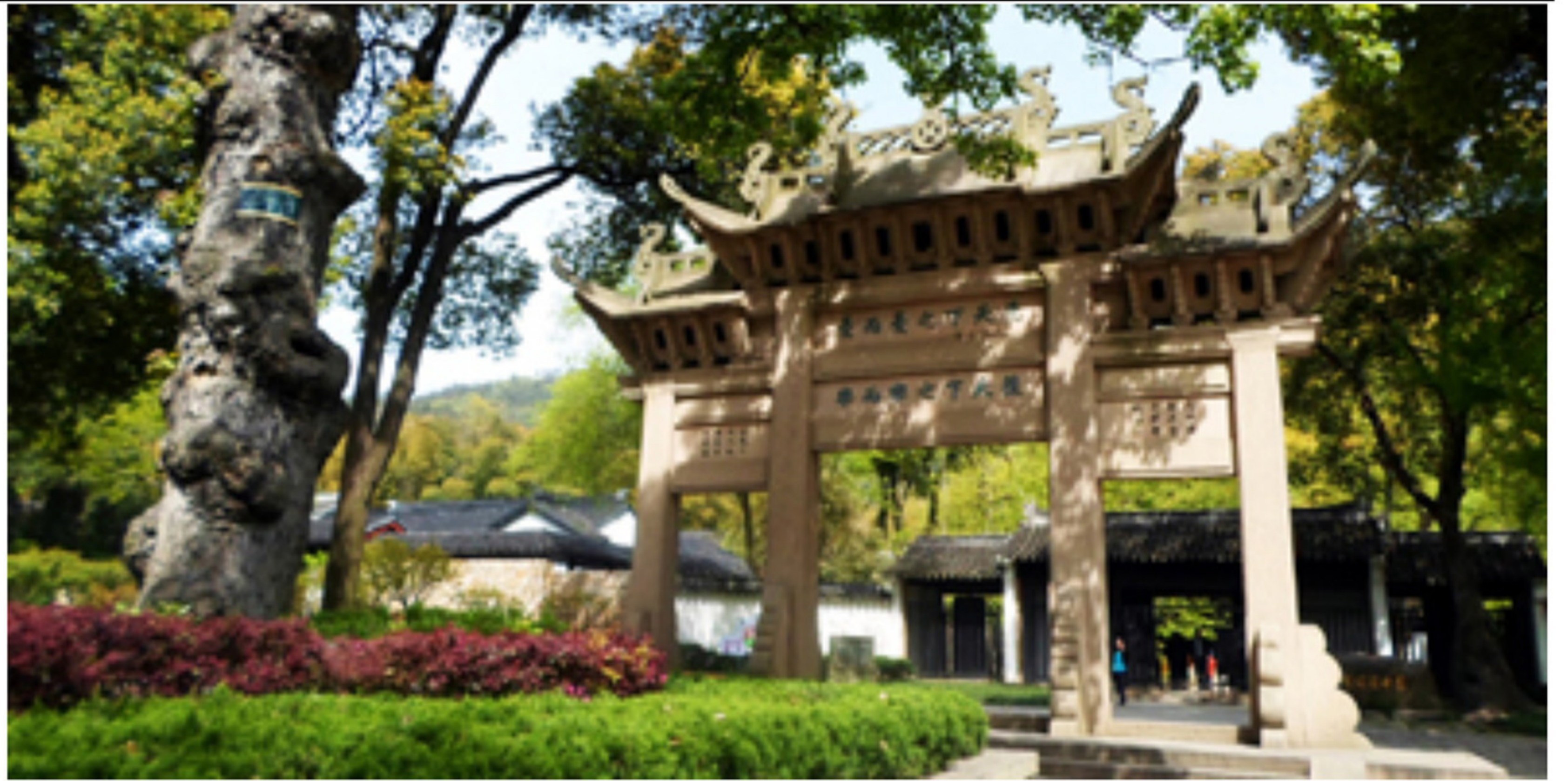
天平山范公祠碑 载名言千户颂，先忧后乐万家师