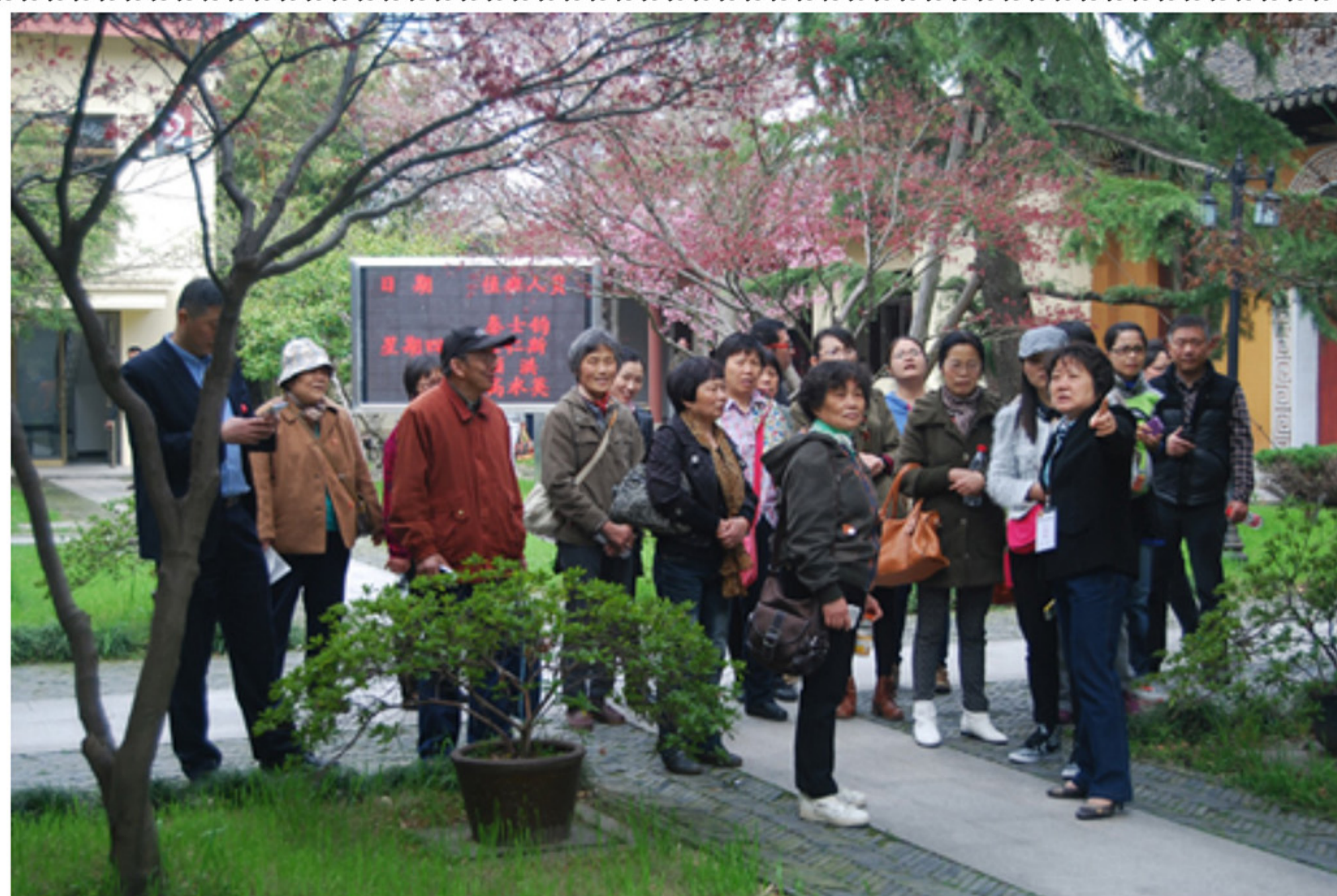
市老龄委领导带领彩民来校查看福彩中心 捐赠资金使用情况。

苏州市老年大学主办 (学习资料 内部交流) 第八十八期 2014年5月1日 电话:65235830 电子邮箱:szlndx@126.com