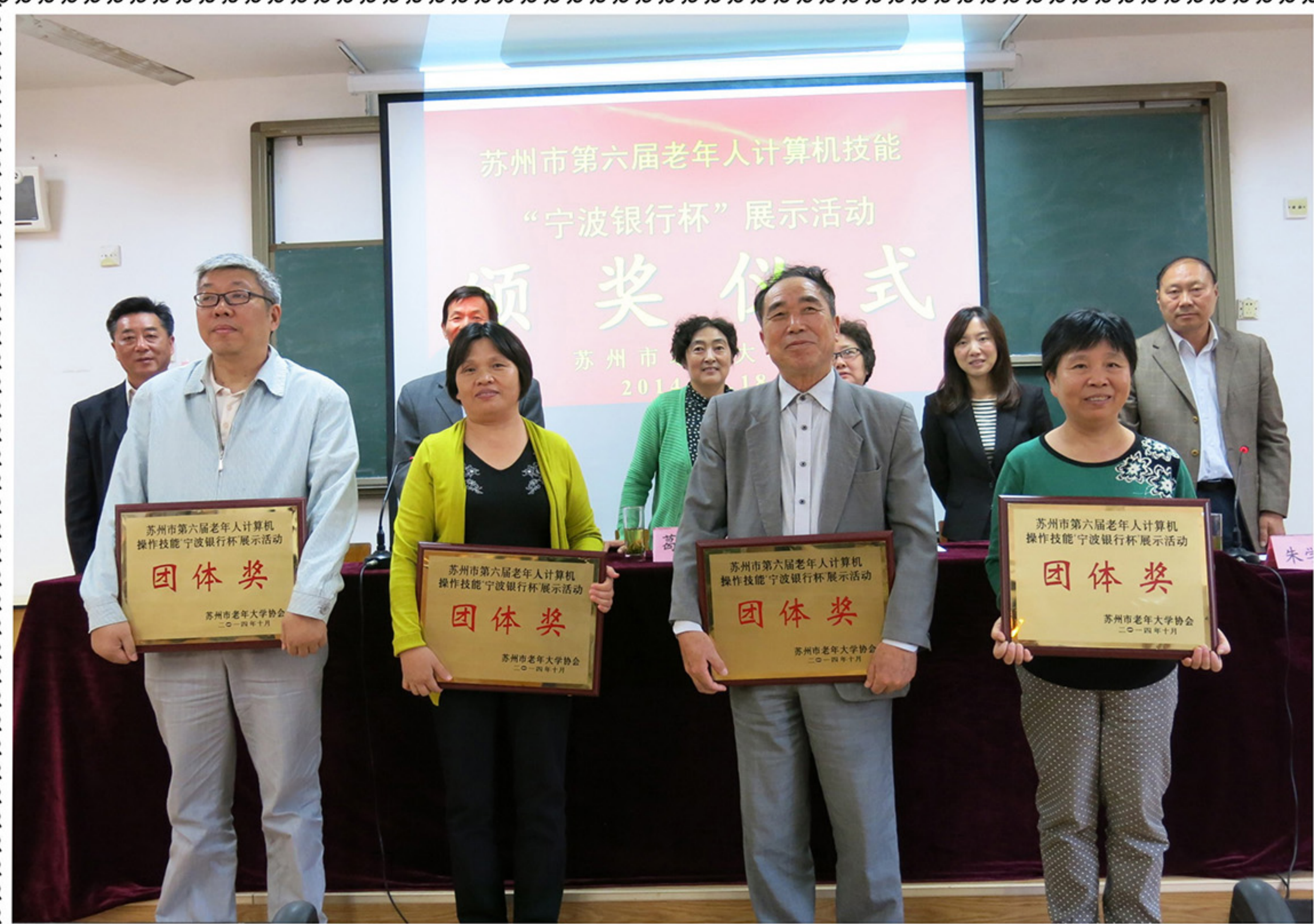
苏州市第六届老年人计算机技能“宁波银行杯”展示活动颁奖仪式

苏州市老年大学主办 (学习资料 内部交流) 第九十二期 2014年11月1日 电话:65235830 电子邮箱:szlndx@126.com