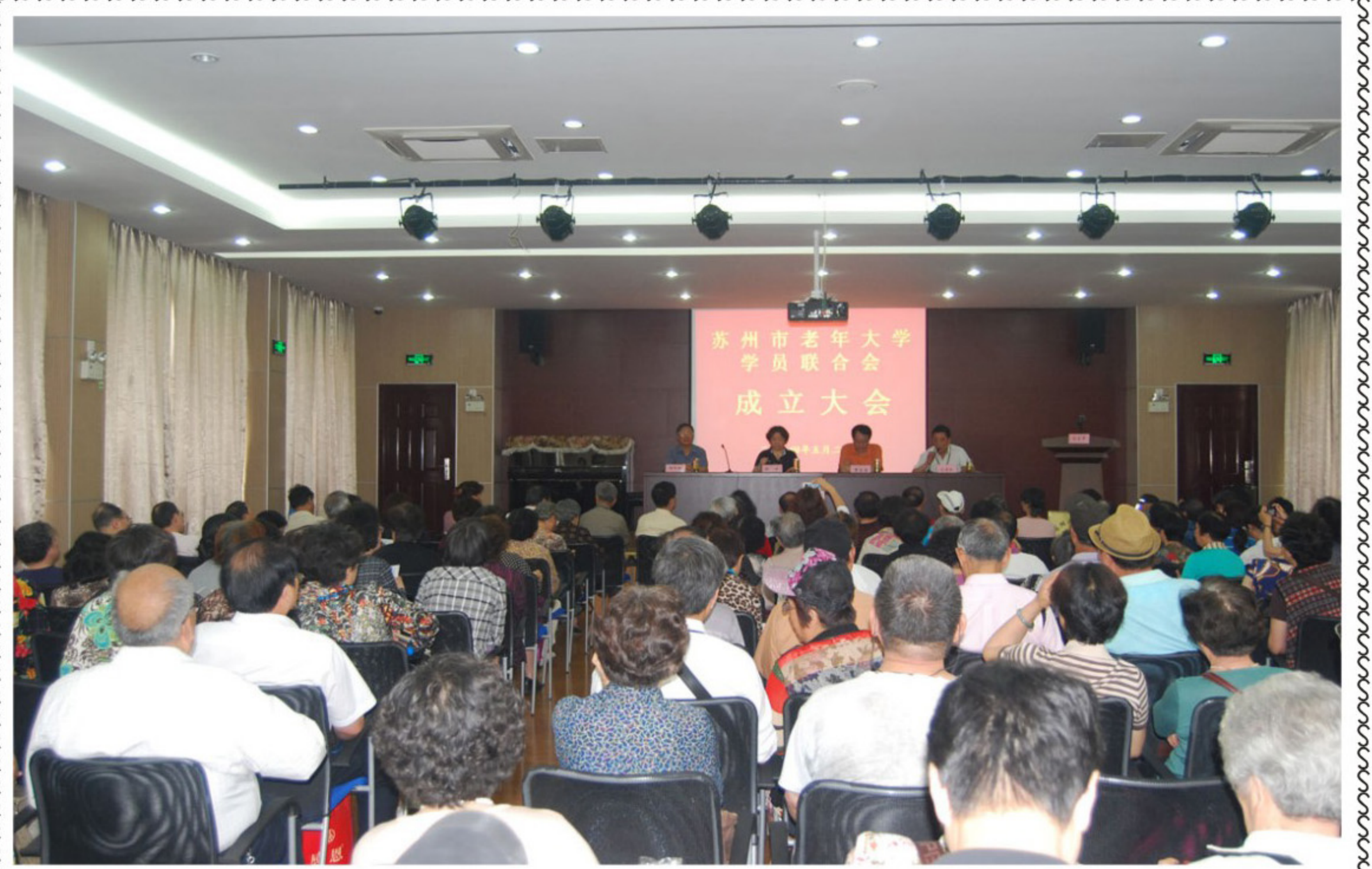
学联会成立大会场景

苏州市老年大学主办 (学习资料 内部交流) 第九十期 2014年9月12日 电话:65235830 电子邮箱:szlndx@126.com