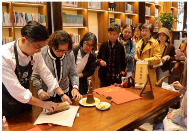
寻觅苏州的“非遗”——学桃花坞木刻年画(徐子钧 供稿)