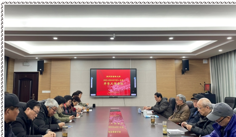
2024年2月28日，学校召开2023—2024学年第二学期工作会议。会议部署了本学期的安全、教学、教师培训、招生、校园文化及创建迎检等推进工作。

学校网址： http://szlndx.suzhou.edu.cn 2024年第1期 总159期 准印证号：S(2024)05000024 (内部资料 免费交流) 2024年03月04日