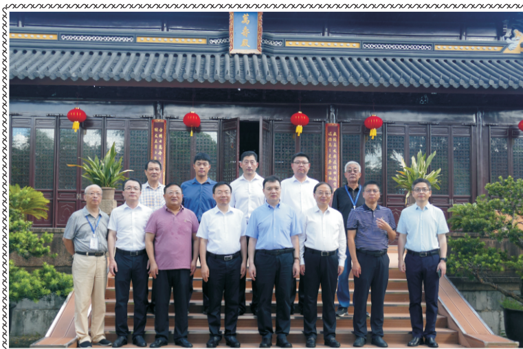
民政部党组成员，中国老龄协会会长刘振国来校调研。（综合办）

学校网址： http://szlndx.suzhou.edu.cn 2024年第6期 总164期 准印证号：S(2024)05000024 (内部资料 免费交流) 2024年10月09日