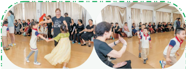
近日，公园幼儿园小朋友到校与我校老年学员一起活动。（综合办）