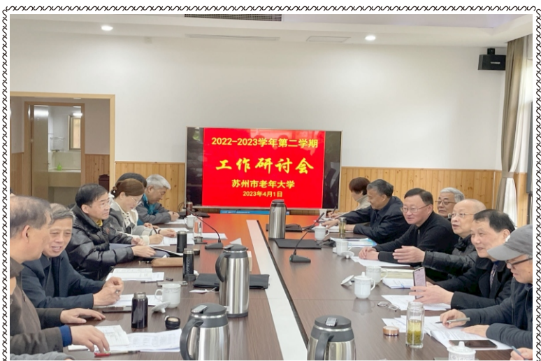
近日，学校工作研讨会召开

学校网址： http://szlndx.suzhou.edu.cn 2023年第3期 总153期 准印证号：S(2023)05000024 (内部资料 免费交流) 2023年05月05日