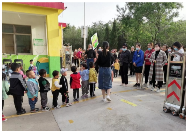
《小的大的都得排队》