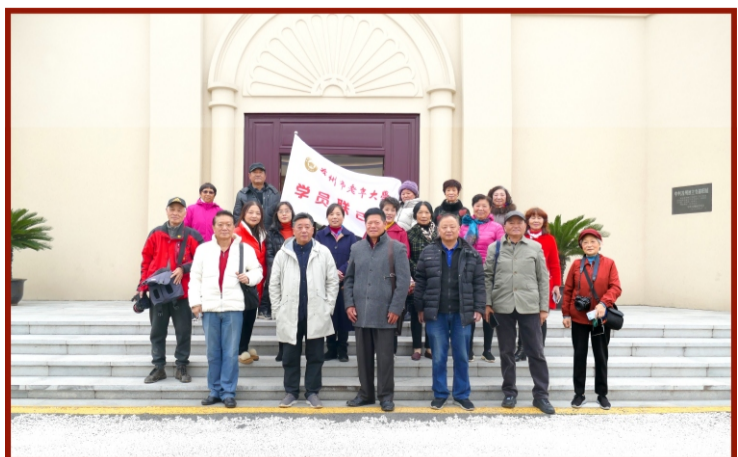
上学期末，学联会成员参观教育基地中共苏州独立支部旧址