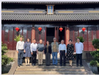
①11月3日，三亚市老年大学考察团莅临我校参观调研。（综合办）