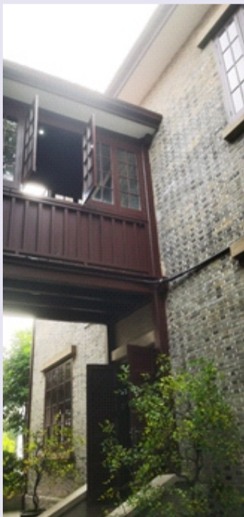
⑦我校8号楼被列入苏州市第二批“历史建筑”名单。（综合办）