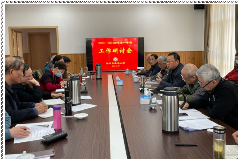
11月25日，学校召开2023~2024学年第一学期工作讨论会。

学校网址： http://szlndx.suzhou.edu.cn 2023年第8期 总158期 准印证号：S(2023)05000024 (内部资料 免费交流) 2023年12月06日