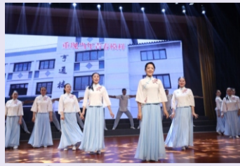
③我校万寿宫艺术团舞蹈“再做读书郎”在“2023苏州首届‘苏康养杯’中老年才艺大赛暨‘家门口老年大学’成果演出典礼”上获一等奖。（艺术团）