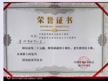
④苏州市老年大学获中国老年大学协会荣誉证书。（综合办）