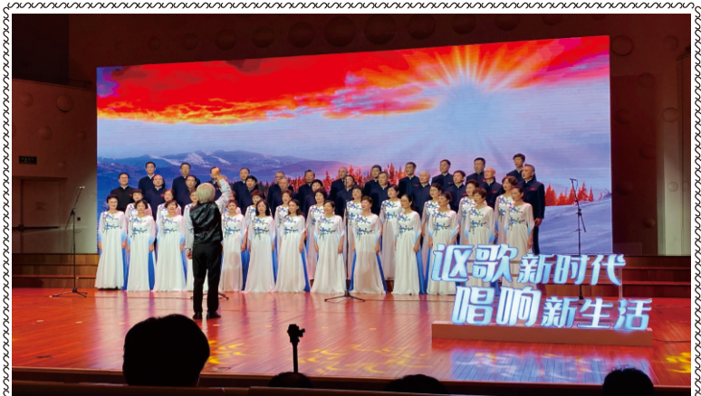
我校万寿宫合唱团在“讴歌新时代 唱响新生活 2023第四届江苏省老年大学合唱节”中获“最佳合唱奖”

学校网址： http://szlndx.suzhou.edu.cn 2023年第7期 总157期 准印证号：S(2023)05000024 (内部资料 免费交流) 2023年11月01日