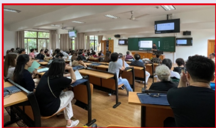
2. 开学前，我校教室更新了教学设施设备，安装了智能触摸一体机，全体教师分批参加了操作一体机的培训，图为器乐系、声乐系、舞蹈系等教师在接受培训。(教务处)