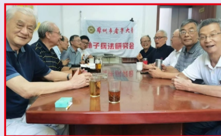
5. 近期，学校孙子兵法研究会召开了理事扩大大会。(孙子兵法研究会)