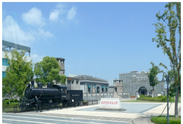
苏嘉铁路遗址公园（李香荪）