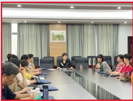
3. 开学前，我校各系分别召开新学期教师会议，系主任通报了我校创建“中国老年大学标准示范校”的工作进度，部署了本学期的教学工作，图为舞蹈系的教师会现场。(教务处)