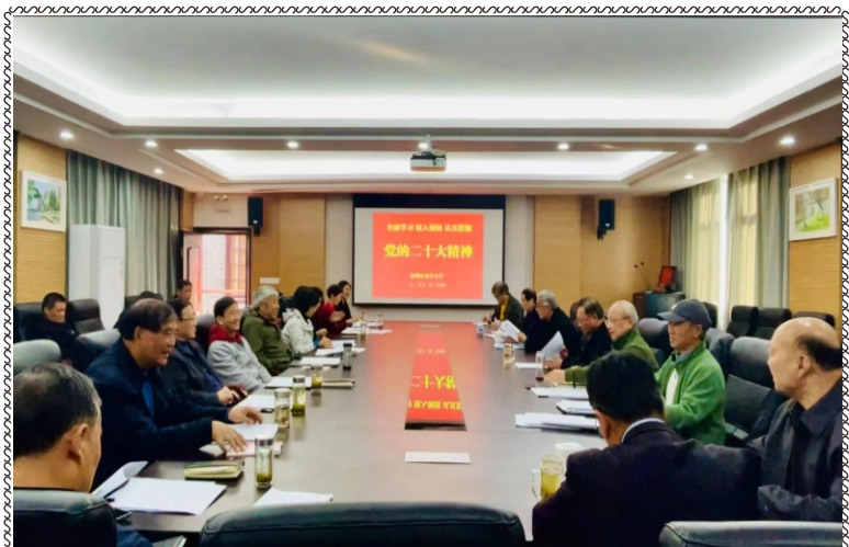
近日, 我校召开学习贯彻党的二十大精神会议(融媒体中心)

准印证号: S(2022)05000024 (内部资料 免费交流 印数七千 发放学员)