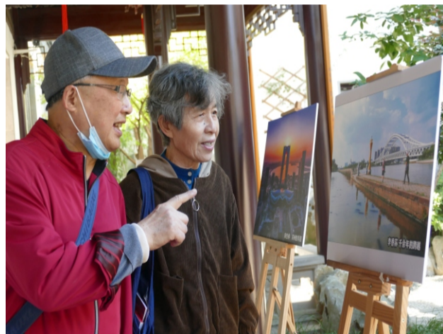
观摩摄影展 赞美新时代

（上接第三版）现在整个世界正处于一个动荡时期，我国正面临一个新的发展时期，所以人民殷切希望党开二十大，可以使全党进一步明确方向，更加努力，攻坚克难，践行使命，带领全国人民开辟新征程，再攀新高峰。所以我用“千镇迎门，万户翘瞻，盼党开廿大”开始。用“定现中国梦，万景斑斓”结束上阙，起到了前后呼应，承上启下的作用。