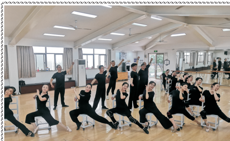
为迎接苏州市老年节,我校舞蹈队老年学员冒酷暑,战高温,不怕苦、不怕累,积极排练原创情景舞蹈。图为排练场景。