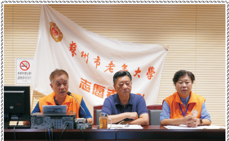
近日,学校志愿者总队举行了学校防疫工作志愿服务动员大会 (李香荪)