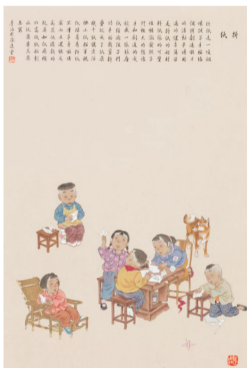
走线杆 | 捉麻雀 做广播体操 | 折纸