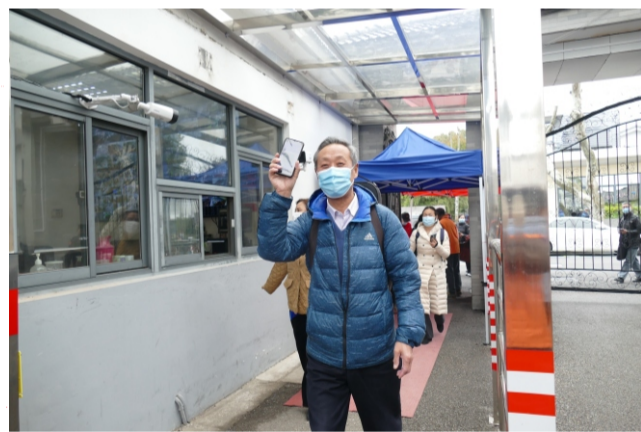
你好，我们来上学了

者文艺委员，在男生们居多的领域里，陆续拿过学院颁发的二等奖，三等奖，也算是巾帼不让须眉了吧。