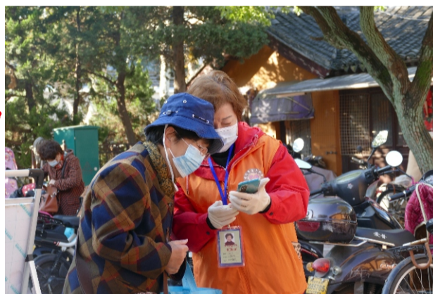
“我来教你怎样查苏康码”