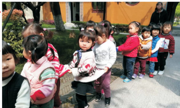
万寿宫里来了小朋友