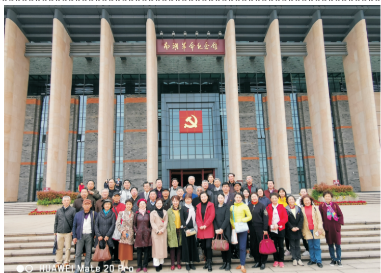
我校教师代表参观南湖革命纪念馆