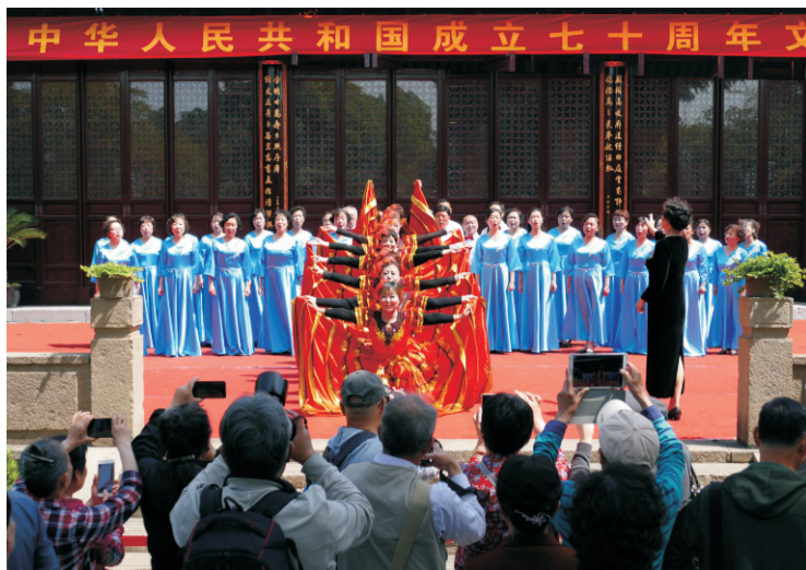
为期一周的“我爱我的祖国”文艺演出于5月20日上午拉开帷幕