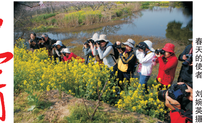
春天的使者

我的一生，好与社会不正之风作斗，因此挫折连连，影响我的前程，但我从无怨悔和后悔。因为一本好书《唐吉珂德》滋养了我的灵魂，受益终身。我坚信：人活在世上不是为了名利地位，而是为人民谋利益才有价值。