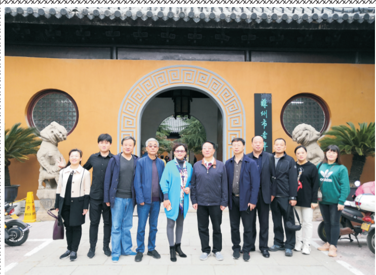
威海市老年大学领导来校考察 办公室