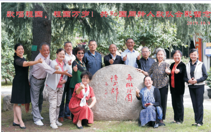
与共和国同龄的歌队