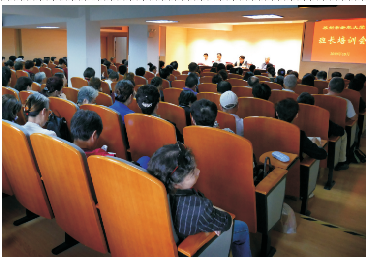
苏州市老年大学2019年秋季班长培训会议