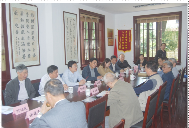
镇江市老年大学代表团来校参观