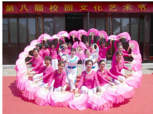
美(李香芬 摄于第八届校园文化艺术节之文艺演出)