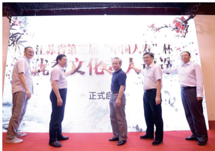
江苏省第三届优秀文化老人评选启动仪式在万寿宫举行(供稿 办公室)