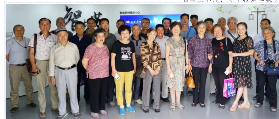
苏州老年大学学员代表莅临联通智慧苏州展厅参观学习

年末联谊会，更是好戏连台，男女歌者高歌引吭，舞林好手，翩翩起舞，越、沪剧清唱当仁不让。（下转第三版）