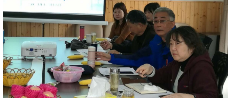
我校本年度秋季学期研讨会掠影