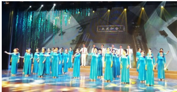
大型文艺汇报演出，在苏州中学礼堂进行