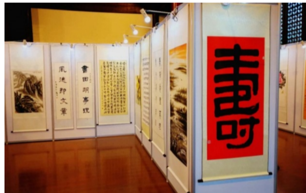
诗书画师生书画联展，在万寿殿古建筑举行书