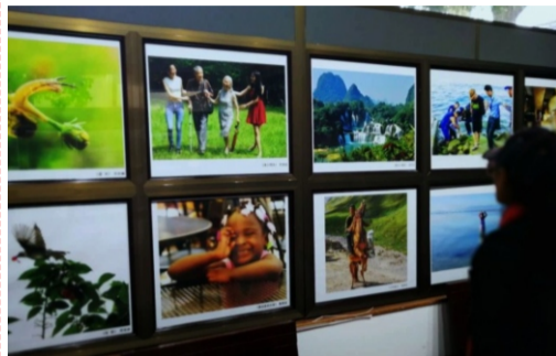
摄影展作品收到500多幅，展出40多幅，展现了老人们对大自然和生活的热爱。

苏州老年大学于1991年迁入万寿宫，如今占地面积达到19.8亩，校园处处显现苏州传统文化特色。