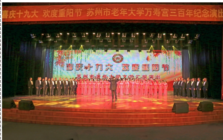
苏州市老年大学万寿宫三百年纪念演出剪影

学校网址： http://szlmdx.suzhou.edu.cn 准印证号：S(2017)05000024