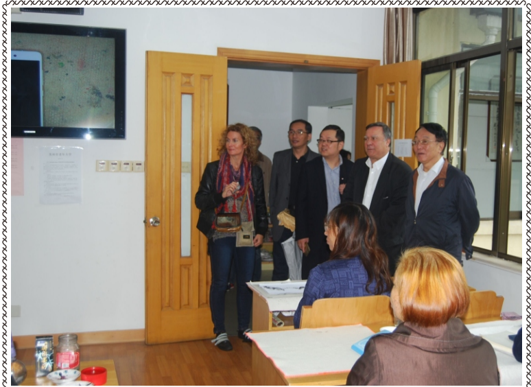
法国格勒诺布尔市副市长来校考察

学校网址： http://www.szindx.net 准印证号：苏出准字 1513554