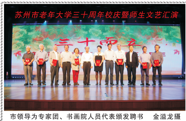
市领导为专家团、书画院人员代表颁发聘书

苏州市老年大学主办 (学习资料 内部交流) 第九十八期 2015年6月1日 电话:65235830 电子邮箱:szlndx@126.com