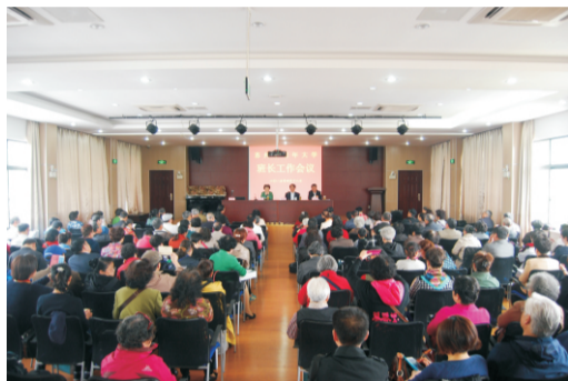
▲4月份学校召开全体班长会议

2014年秋季学期我校获得“江苏省示范老年大学”的光荣称号，各位班长的热情配合提供了有力的支持。2015年春季学期，我们学校又被中国老年大学学会命名为国家级的“五个十工程·地级校项目”